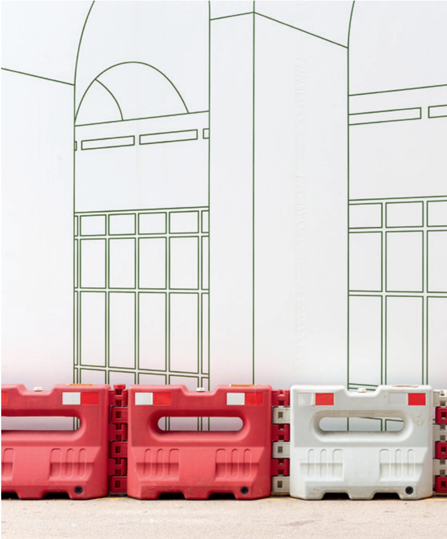
i.e. #57 (Hong Kong), 2014