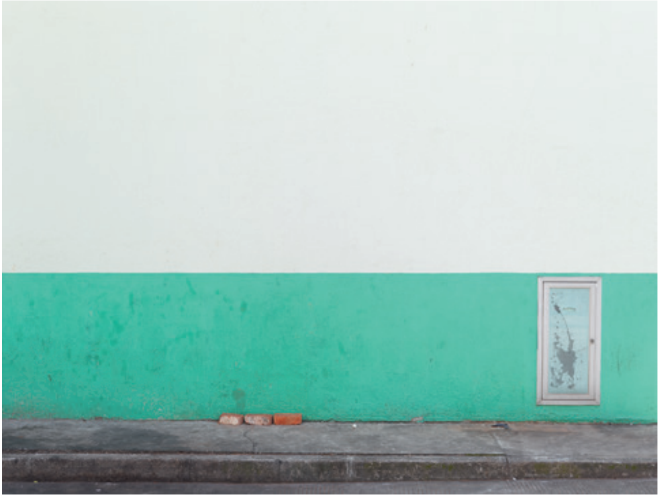
i.e. #67 (Macau), 2014