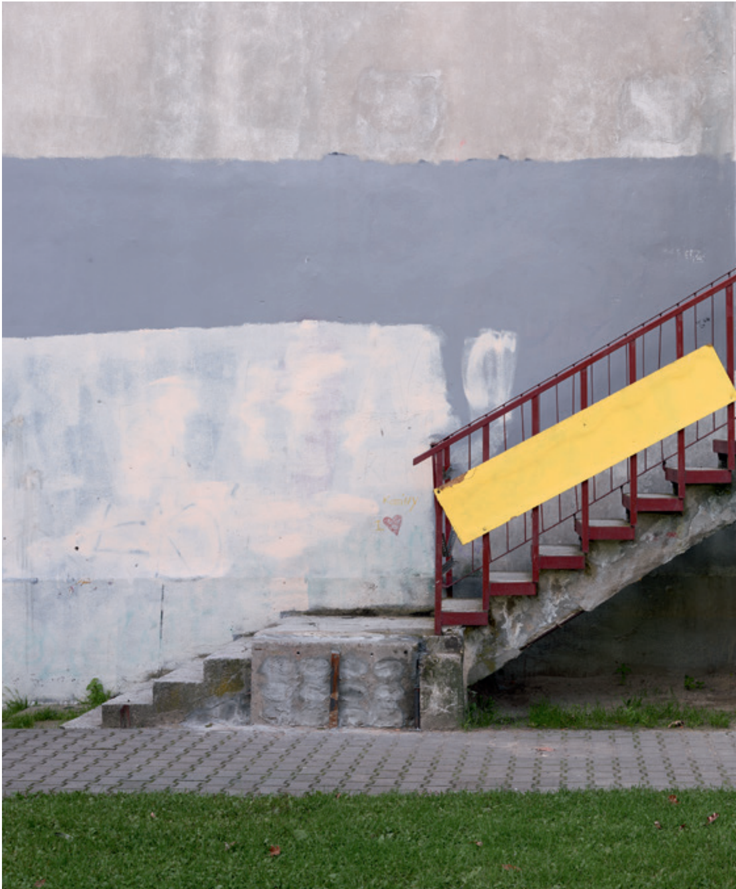
i.e. #3 (Lodz), 2014