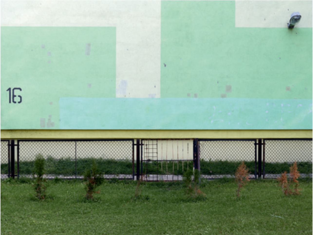
i.e. #2 (Lodz), 2014