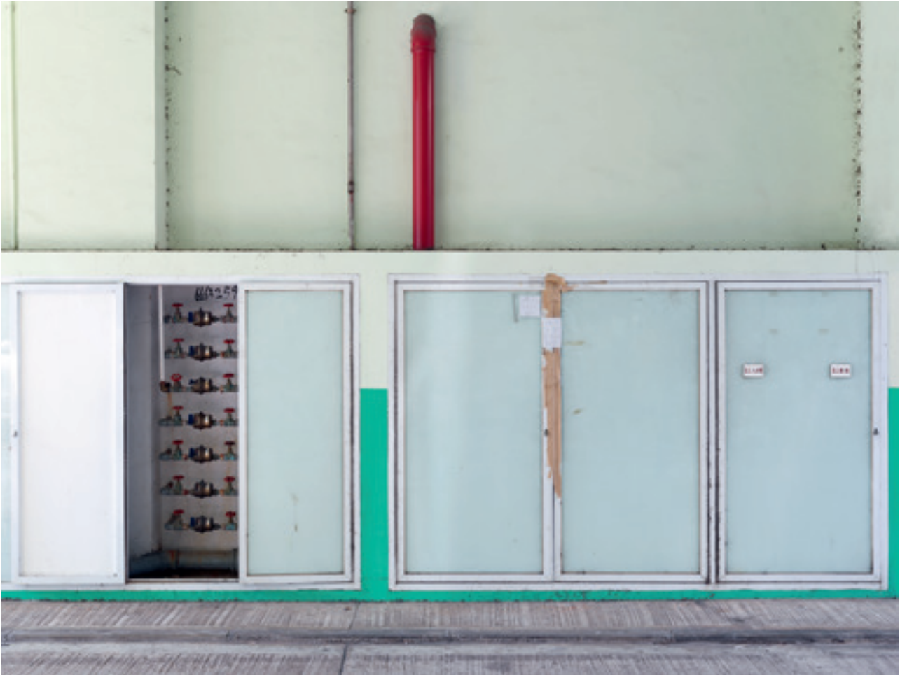
i.e. #68 (Macau), 2014