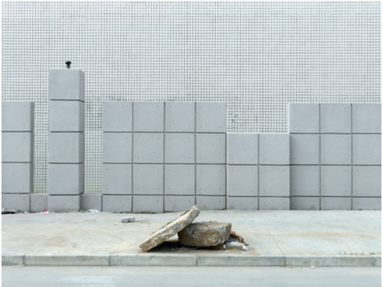
i.e. #45 (Macau), 2014