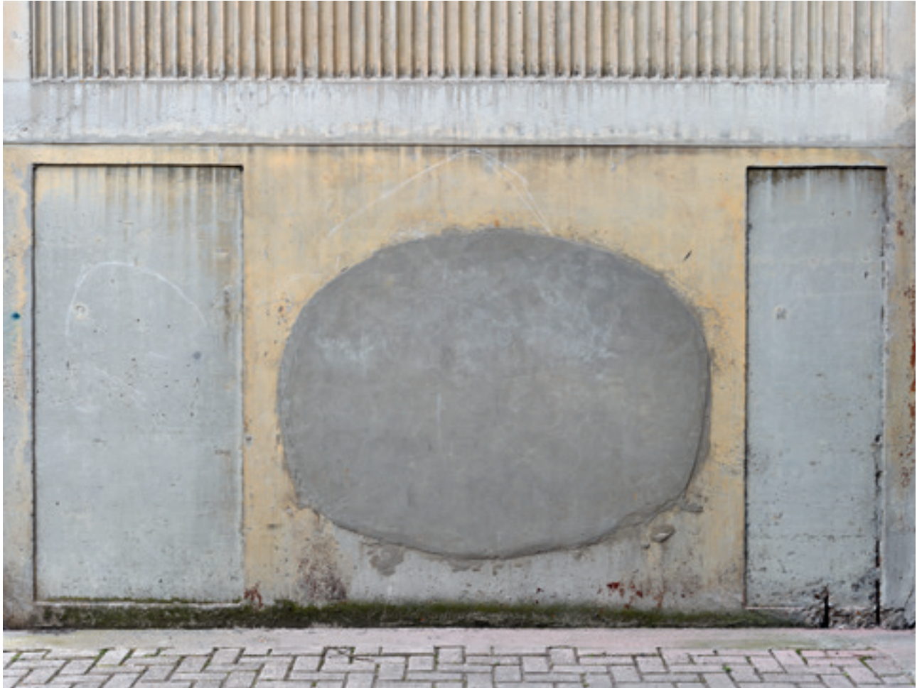
i.e. #75 (Deurne), 2015