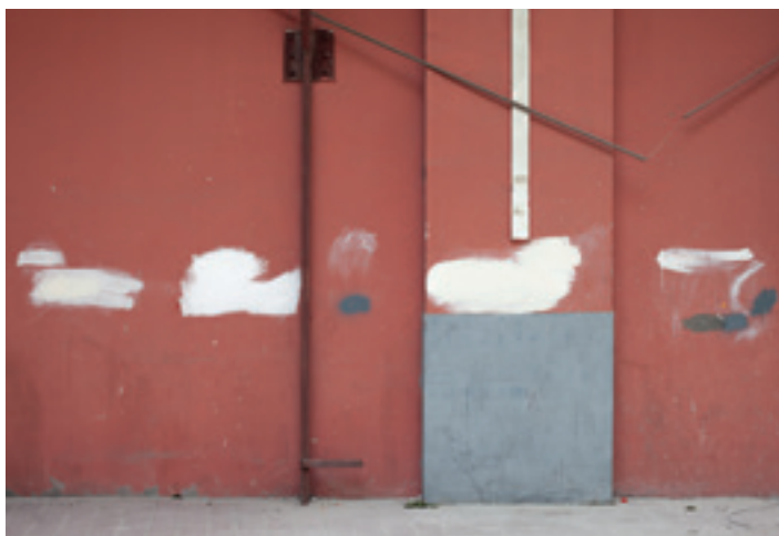
Bert Danckaert, Simple Present #703 (Guangzhou) , 2013.