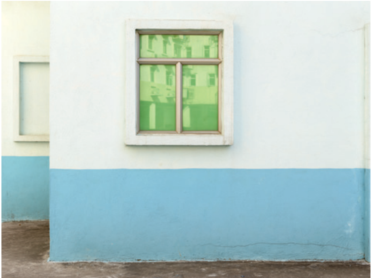
i.e. #66 (Macau), 2014