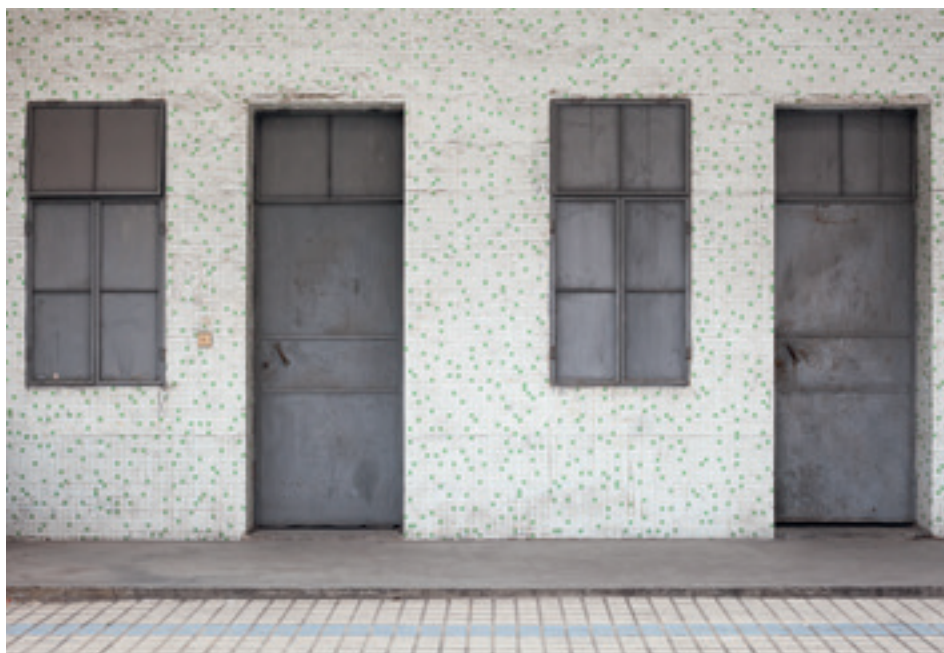
Bert Danckaert, Simple Present #701 (Guangzhou) , 2013.