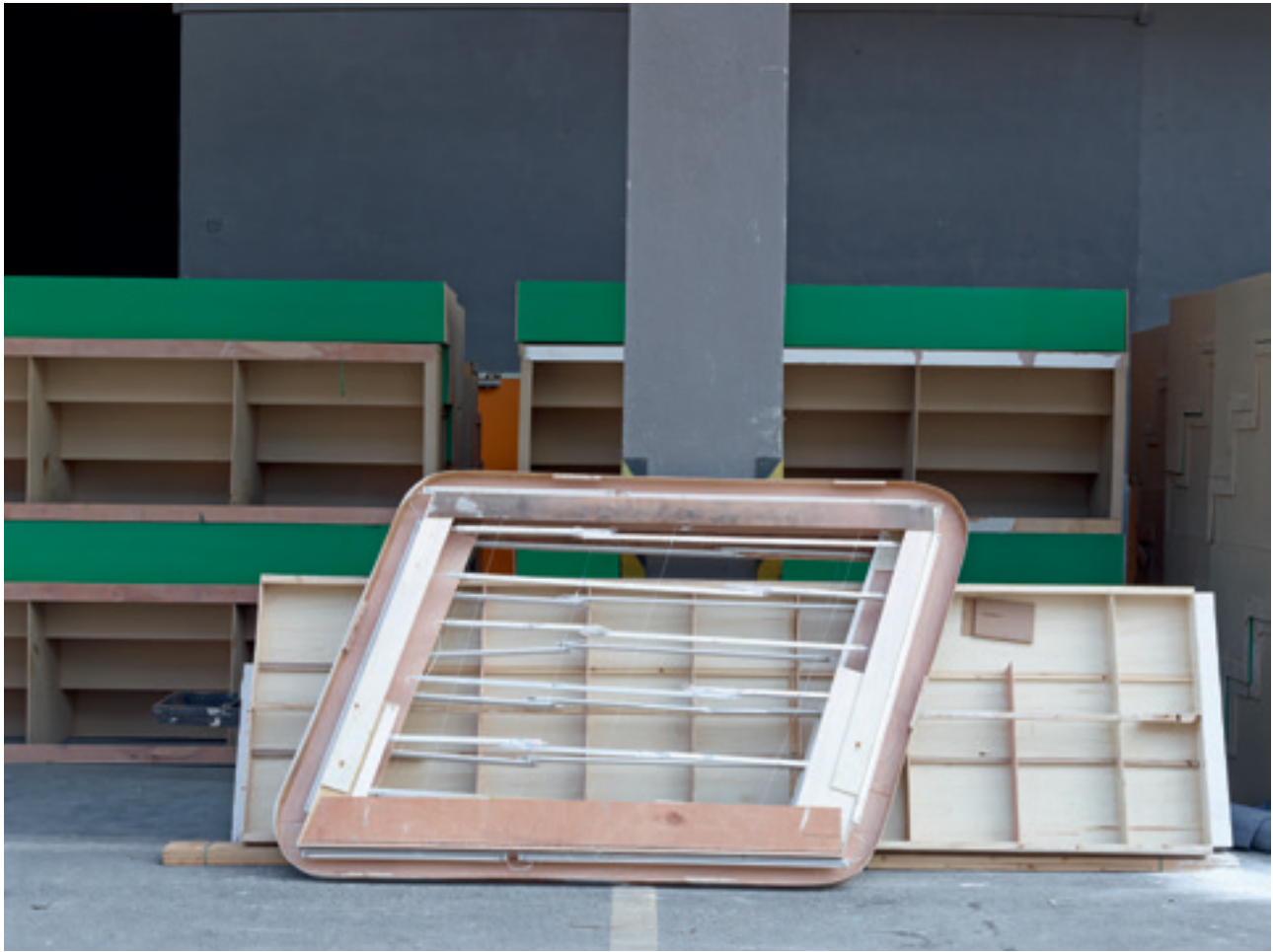
i.e. #20 (Guangzhou), 2014