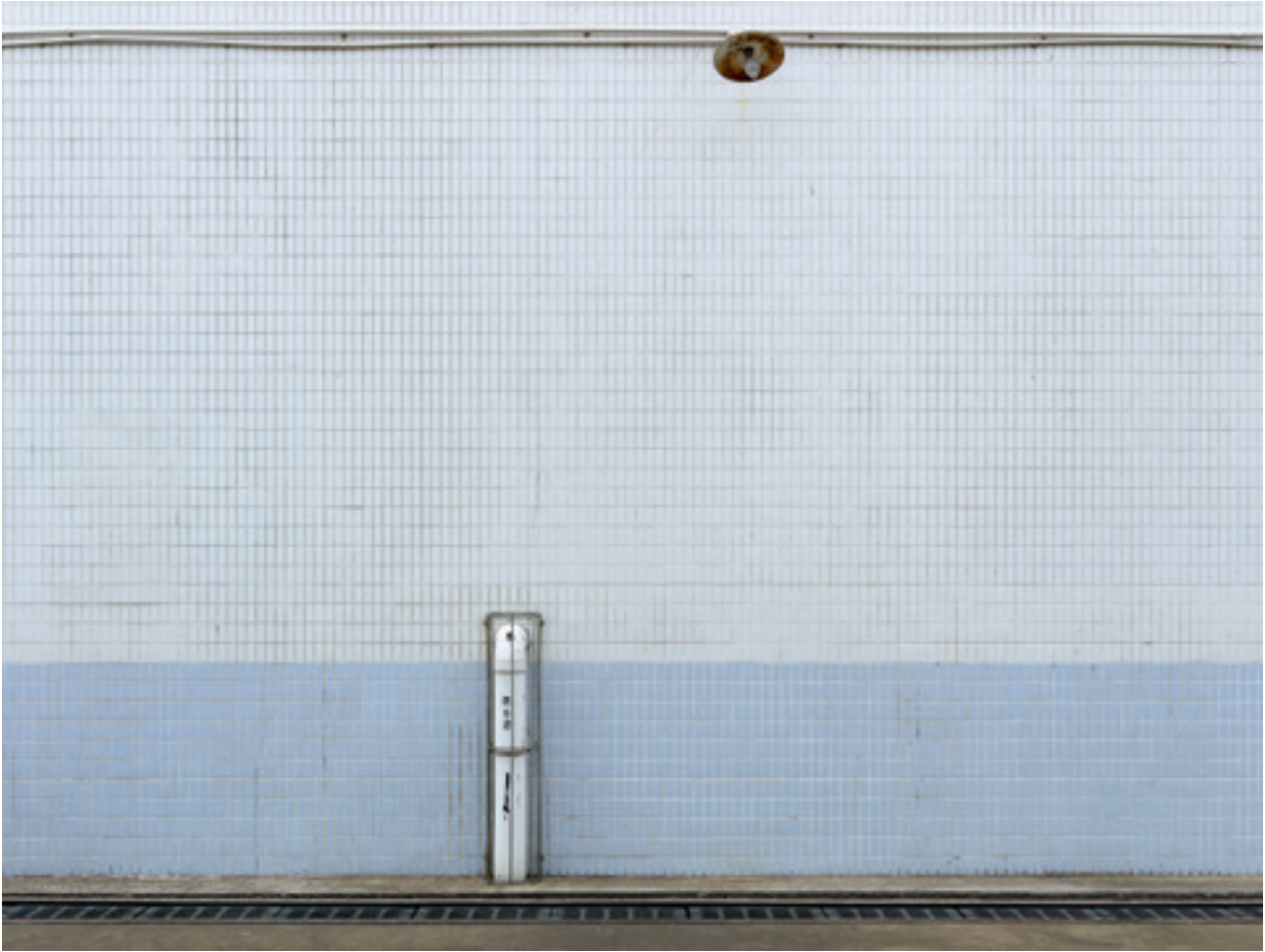
i.e. #26 (Guangzhou), 2014