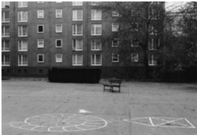
Bert Danckaert, Oost-Berlijn (uit de serie Coulissen ), 1991.