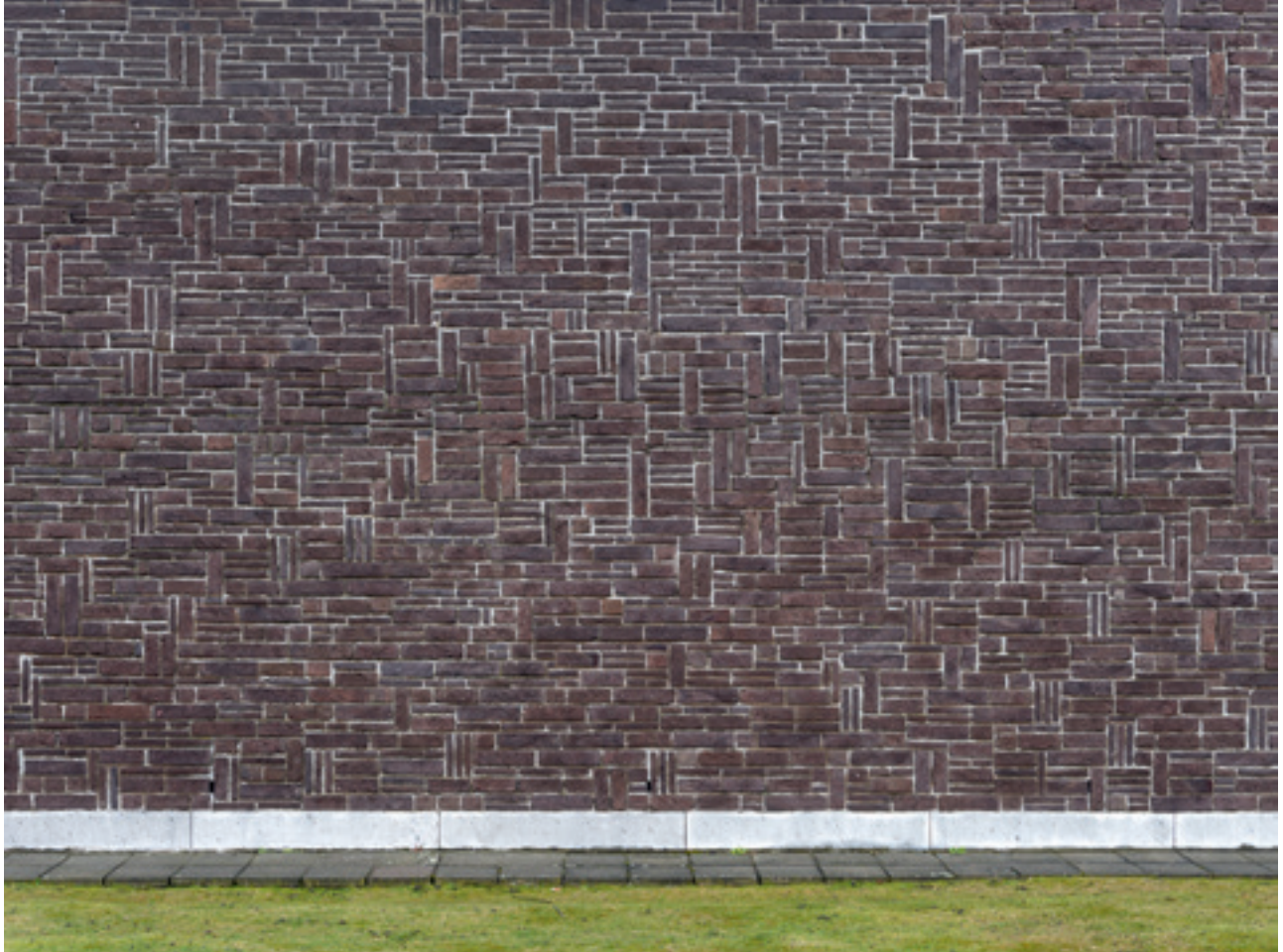
i.e. #73 (Deurne), 2015