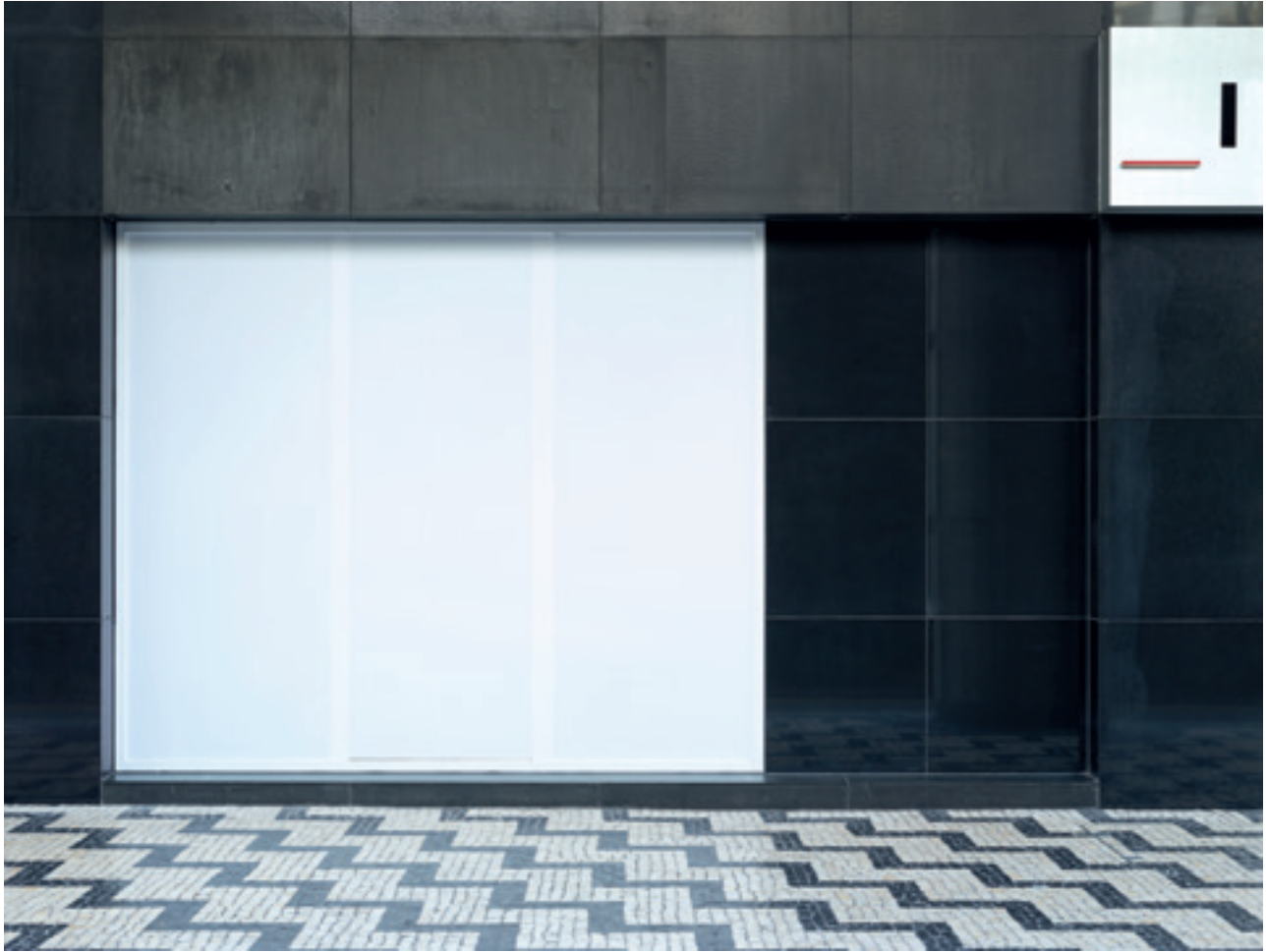
i.e. #50 (Macau), 2014