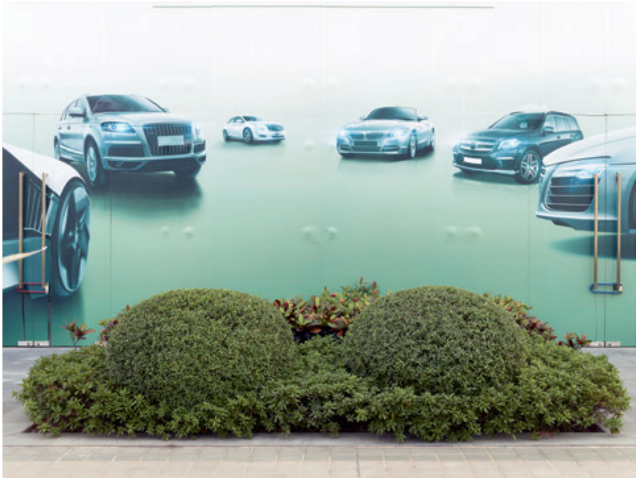
i.e. #26 (Guangzhou), 2014