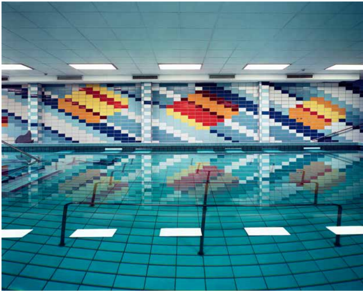
Lynne Cohen - Recording Studio - 1987, Courtesy Rodolphe Janssen