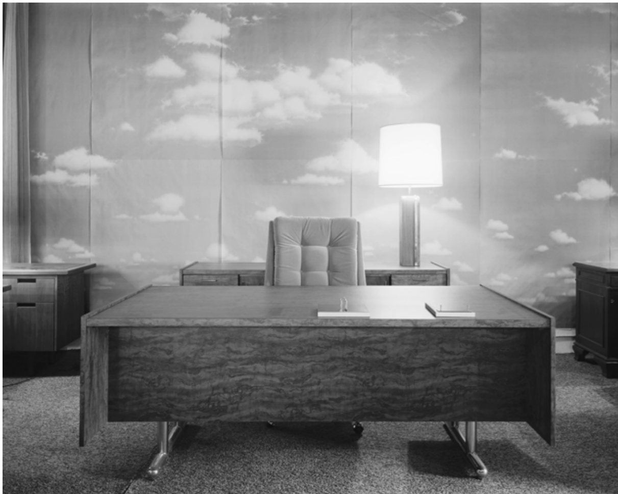
Lynne Cohen - Corporate Office - 1986