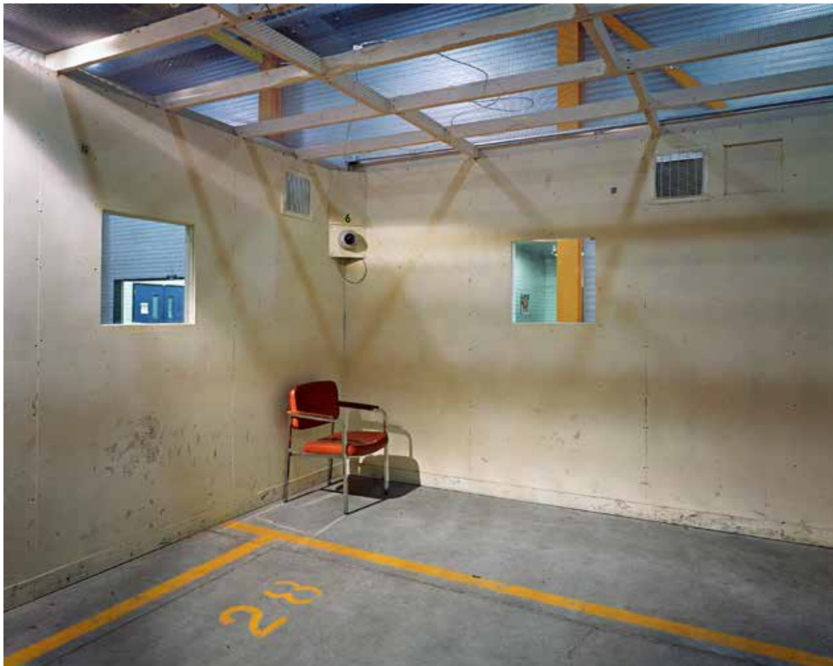
Lynne Cohen - Recording Studio - 1987, Courtesy Rodolphe Janssen